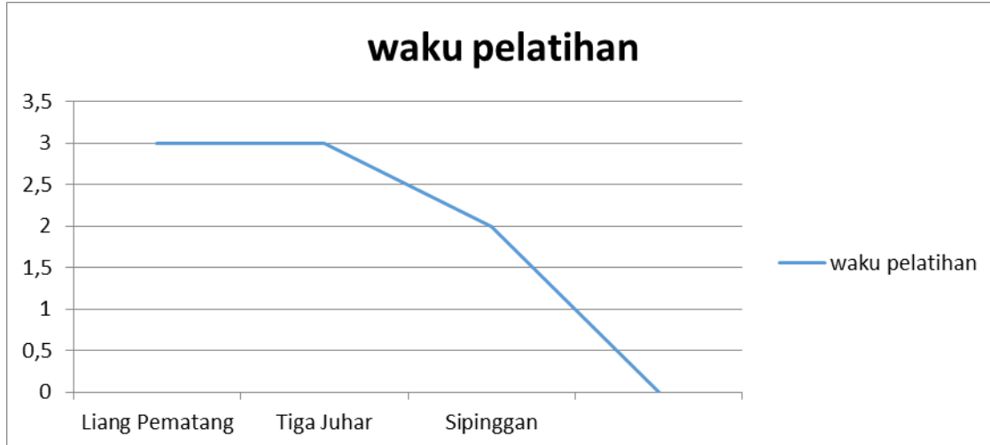
Gambar 2 : Grafik waktu pelatihan yang dibutuhkan sampai mitra terampil